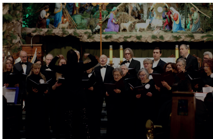
Połączone chóry Largo Cantabile z Parafii Ewangelicko-Augsburskiej w Katowicach oraz Largo ze Świętochłowic pod dyrekcją Igi Eckert