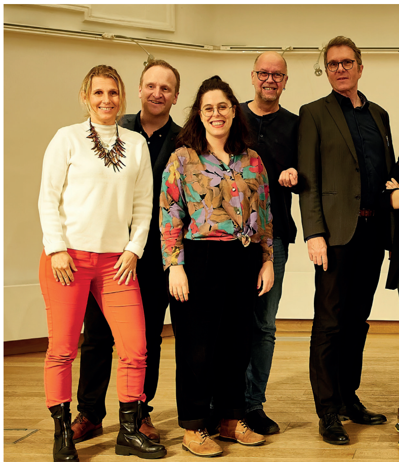
Nowy zarząd Europejskiego Stowarzyszenia Chóralnego

Europejskie Stowarzyszenie Chóralne zgromadziło członków i partnerów w Leuven w Belgii w weekend (16-17 listopada 2024 roku) na zgromadzeniu ogólnym, którego gospodarzem było flamandzkie stowarzyszenie Koor & Stem. Wydarzenie umożliwiło członkom i przyjaciółom Stowarzyszenia zapoznanie się z jego