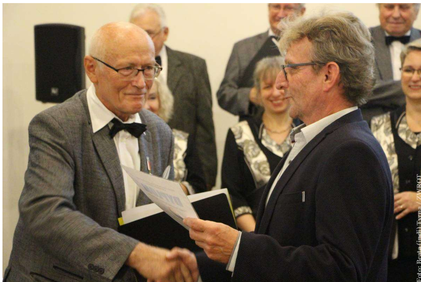
Cantate Deo z Częstochowy