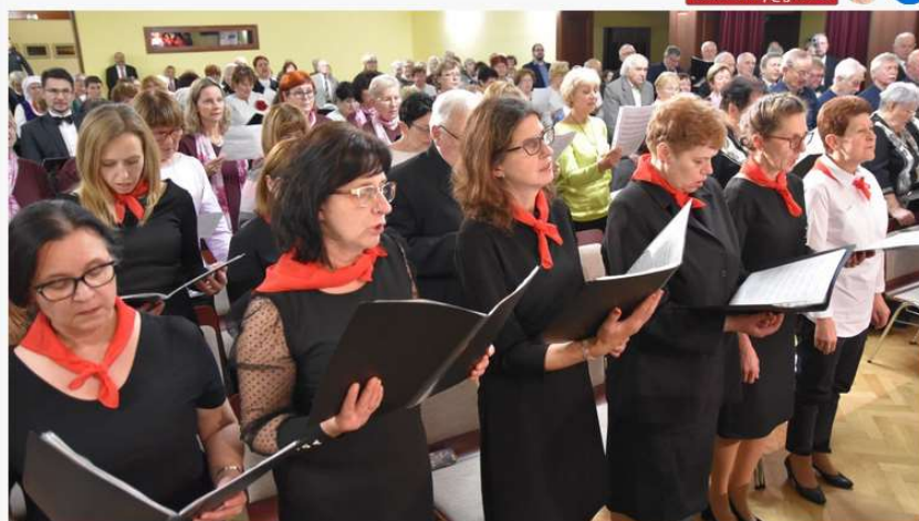
Koncert zakończył się wspólnym śpiewem hymnu „Bogurodzica”.